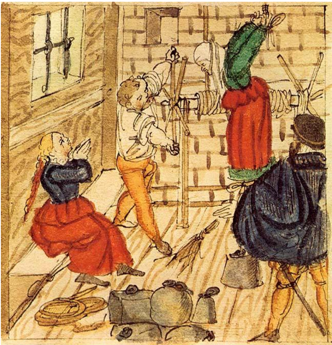
Marteling en verhoor

Heksen en tovenarij zijn 'hot'. Denk maar aan de Harry Potter-gekte, de meiden van Charmed, de heksen van Roald Dahl, maar ook aan het succes van moderne natuurreligies en heksenverenigingen zoals Wicca. Is deze aandacht voor het occulte meer dan een hype? Als we teruggaan in de tijd zien we dat men altijd al geboeid is geweest door heksen en tovenaars. In deze lezing wordt onderzocht hoe hekserij en heksenwaan zich konden manifesteren. We overlopen de houding van de overheid tegenover toverij en magie, en niet in het minst de visie van de Kerk. We zien hoe in de 16de en 17de eeuw de heksenvervolging haar hoogtepunt bereikte. De aard van de aantijgingen, de procesvoering, de harde manier van ondervragen, de weerzinwekkende folteringingen, de rokende brandstapels, dit alles komt aan bod. Bloedstollende getuigenissen en illustraties zijn rechtsreeks uit de archieven gehaald en vormen dus echte getuigenissen.