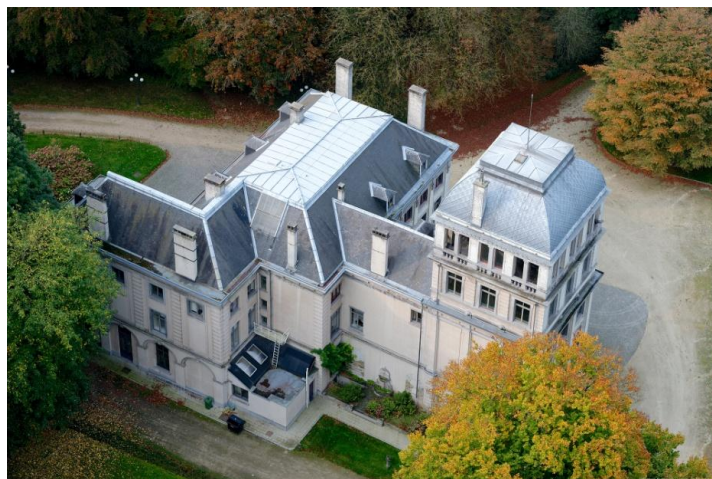
Kasteel Hertoginnedal te Oudergem