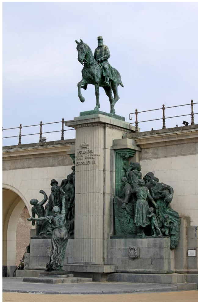
Ruiterstandbeeld van Koning Leopold II te Oostende

Die gift kwam er op drie voorwaarden. De gronden en gebouwen mochten nooit verkocht worden. Ze moesten ter beschikking staan van de troonopvolgers en sommige ervan moesten hun oorspronkelijke functie en uitzicht bewaren.