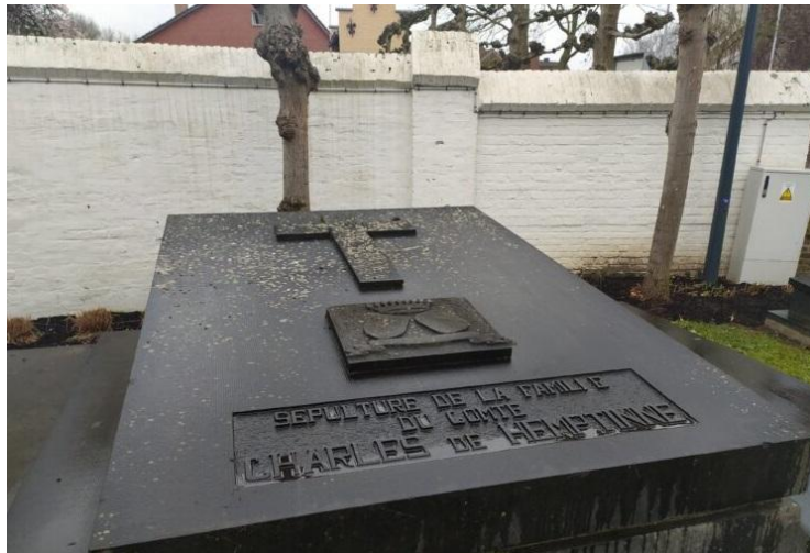
Charles de Hemptinne

De aanpalende begraafplaats van Afsnee is de kleinste en met haar ligging vlak naast de Leie zonder twijfel de meest idyllische van alle Gentse begraafplaatsen.