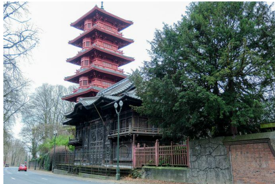
Japanse toren en Chinees paviljoen te Laken