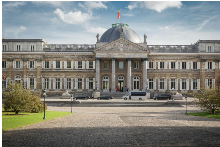
Kasteel van Laken

(domeinen ter beschikking gesteld van het Koningshuis)