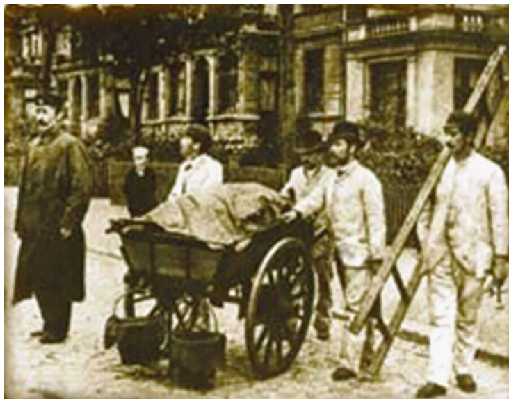
Cholera epidemie - Hamburg 1892