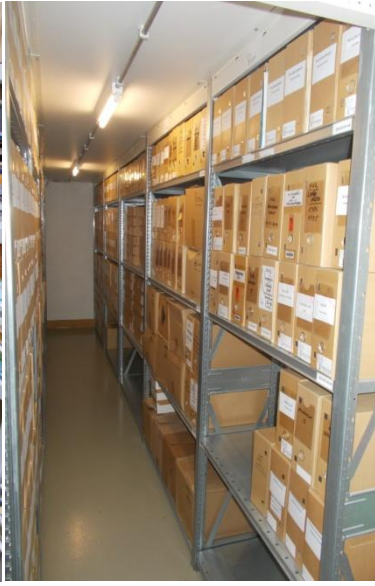
in het archief