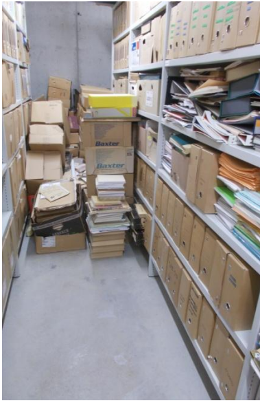
in de kelder