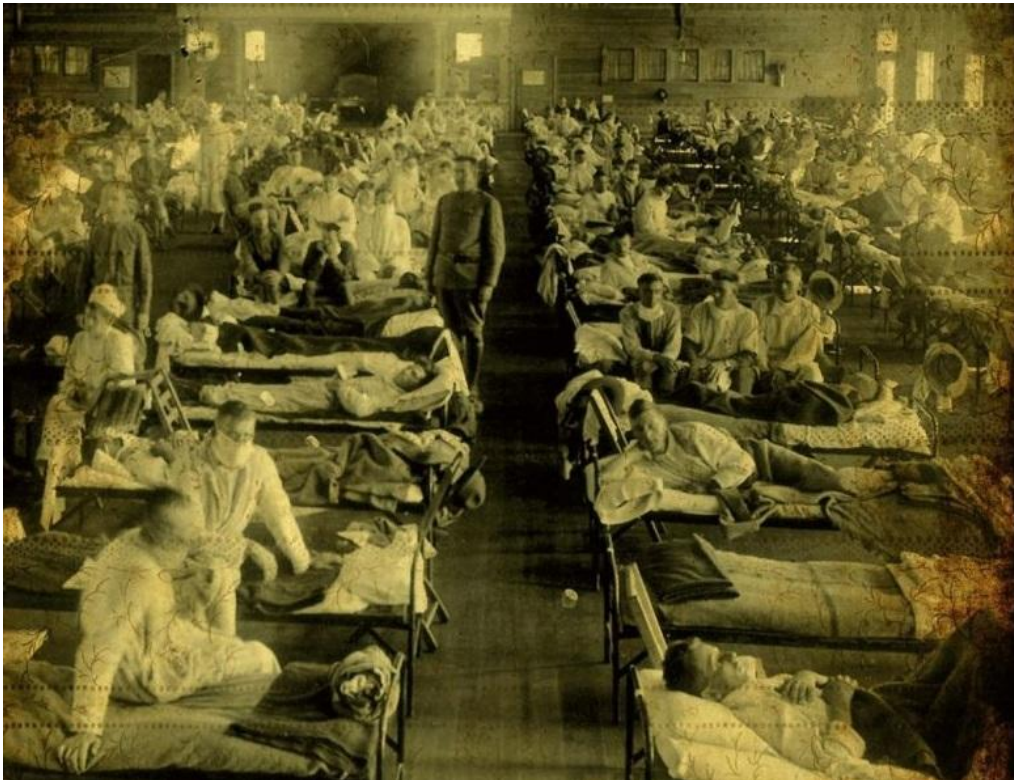
"Spaanse griep" pandemie - 1918