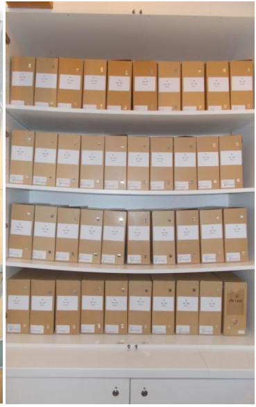
in de 'Groene zaal'