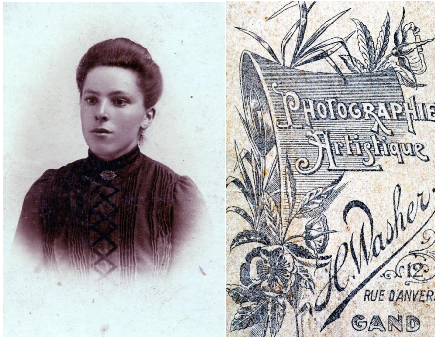
G. DE LATHAUWER - Dendermondsesteenweg, Gent - tussen 1895 en 1905