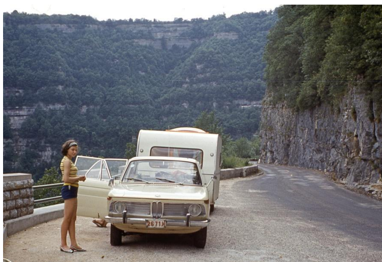
Zomer 1967 - De familie Neyt uit Evergem op reis met de caravan naar Zwitserland en Italië (BMW model 1965 en caravan De Reu)