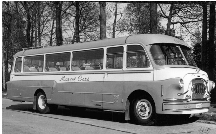
1958 - Autocar Van Hool