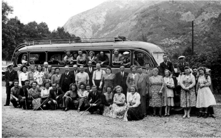
1948 - Groepsreis van de NMBS vanuit Gentbrugge naar de Pyreneeën