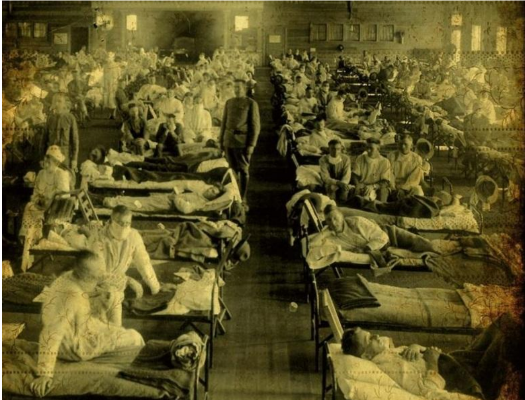
"Spaanse griep" pandemie - 1918