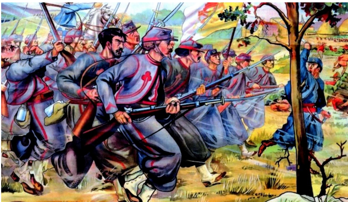
De Pauselijke Zoeaven (1860-1870)

De lezing 'De zoeaven, ook van bij ons' wordt ondersteund door een interactieve power-point-presentatie en wordt telkens aangepast met een bespreking van de zoeaven vanuit uw buurt die naar Rome trokken.