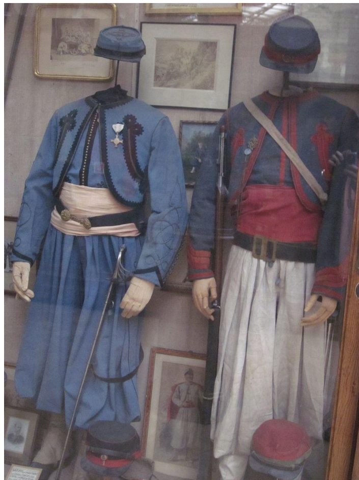
Uniformen van de Belgische Zoeaven

De eerste zoeaven waren echter een onderdeel van het Franse leger. Zij waren zo bekend om hun dapperheid en loyaliteit dat er ook in andere landen, zelfs buiten Europa, zoeavenkorpsen werden opgericht. De Franse zoeaven hebben bij ons in W.O. I een belangrijke bijdrage geleverd. Officieel sneuvelden er in ons land 7651 Franse 'zouaves'. De Franse zoeaven werden ontbonden in 1962, bij de onafhankelijkheid van Algerije.