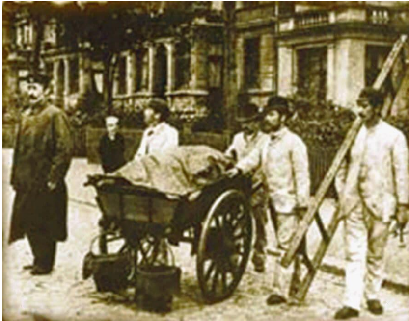
Cholera epidemie - Hamburg 1892