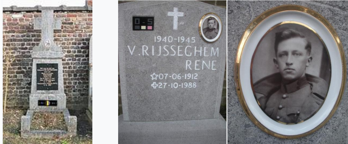
Twee van de talrijke Belgische graven

Op de begraafplaats ligt het graf van een niet geïdentificeerd slachtoffer uit de Tweede Wereldoorlog. Het gaat om een militair van het Gemeenebest van Naties en hij zou gesneuveld zijn op de 7 of 8 september 1944. Zijn graf wordt onderhouden door de Commonwealth War Graves Commission en is er geregistreerd onder Destelbergen Communal Cemetery.