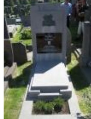
Seiger (kerkmuur) - della Falle d'Huyse (nabij kerk) - Vlerick (nabij ingang)