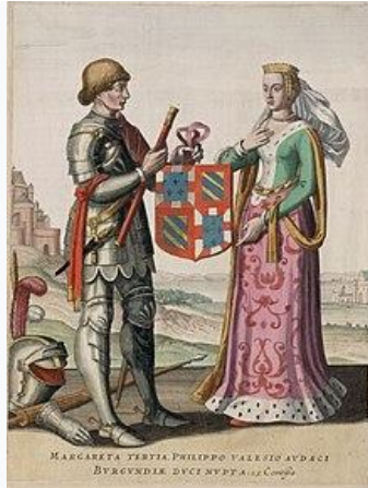
Gravin Margaretha met haar echtgenoot Filips de Stoute (afbeelding uit Flandria illustrata , 1641)