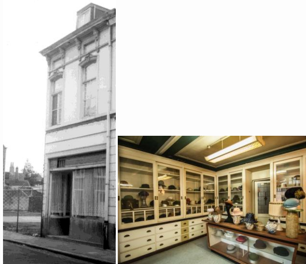
Winkel van de hoedenmakerij Lambrecht-Dooms in de Kerkstraat

Het Liberaal archief neemt deel onder het motto "Hoedje af" met een tentoonstelling over het ambacht van de hoedenmakerij, die overigens doorloopt tot augustus 2019. Familiekunde Gent sluit hier bij aan met een kleine tentoonstelling over een familiebedrijf van hoeden- en pettenmakers uit Gentbrugge dat 75 jaar heeft bestaan, van 1885 tot 1960.